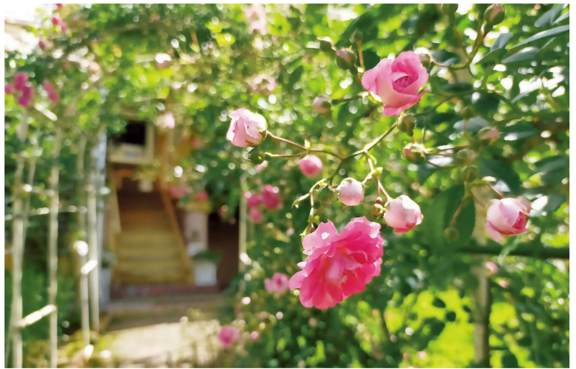
オープンガーデン(原村ペンションビレッジ)

原村高原朝市 7月16日~9月25日 6:30~8:00 朝市広場 (但し、7・9月は土・日曜日、祝日開催)