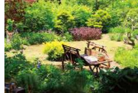
ペンションビレッジ