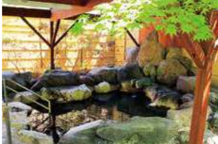
八ヶ岳温泉 (もみの湯・縦の木荘)