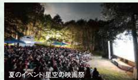
夏のイベント 星空の映画祭