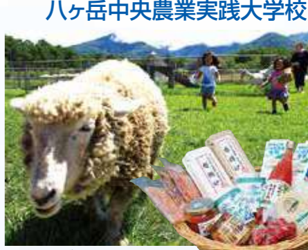
八ヶ岳中央農業実践大学校

《たてしな自由農園・原村店》 ●営業時間 9:00~17:30 ●定休日 5月~11月は無休、12月~4月は水曜日 ●住所 原村18101-1 ●電話 0266-74-1740