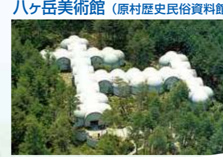
八ヶ岳美術館 (原村歴史民俗資料館)

《直売所》 ●営業時間 9:00~17:00 (12~3月 9:30~16:30) ●定休日 年末年始 ●住所 原村17217-118 ●電話 0266-74-2080