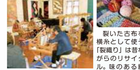
クラフト (手織り工房 織音舎・原村郷土館)