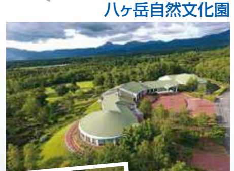
八ヶ岳自然文化園