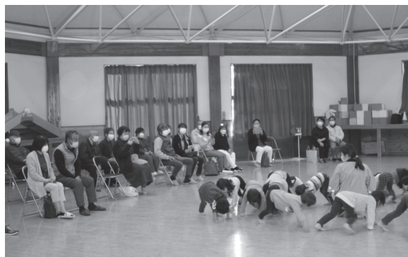
祖父母参観日 年少組お楽しみ会