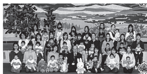
令和3年度原村誕生会(前期)

1歳になるお子さんを対象に年2回開催します。「赤ちゃんが会う初めての絵本」としてファーストブックとお子さんの図書カード、記念品の贈呈を行いお子さんの健やかな成長をお祝いします。