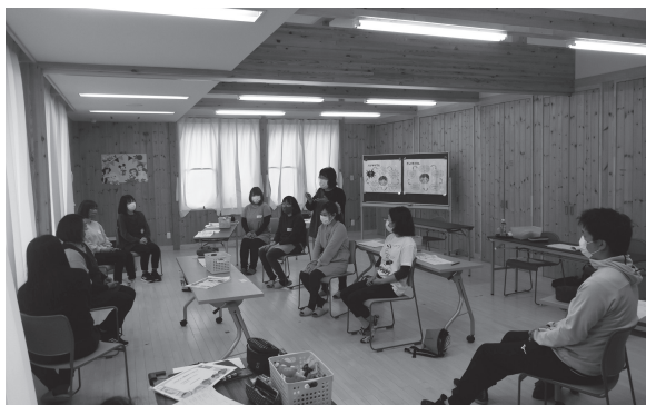
2歳児保護者対象わくわくの日