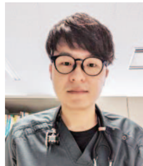
諏訪中央病院 総合診療科