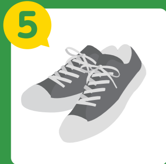
5 避難するときはひも靴などの脱げにくい靴を履く