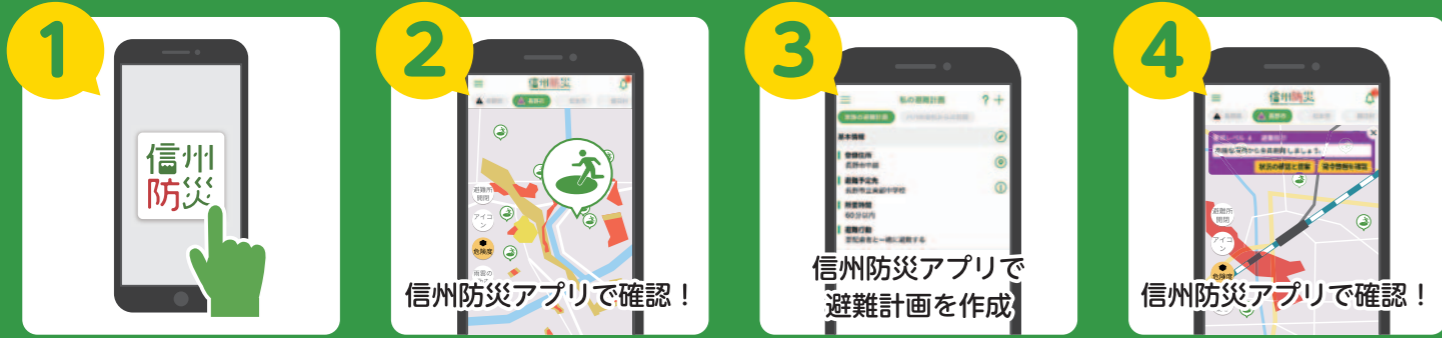
1 信州防災アプリをインストール