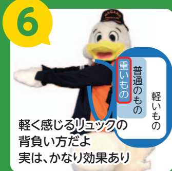
6 軽く感じるリュックの背負い方だよ 実は、かなり効果あり