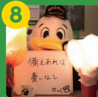
8 懐中電灯にポリ袋をかぶせると、簡易ランタン!