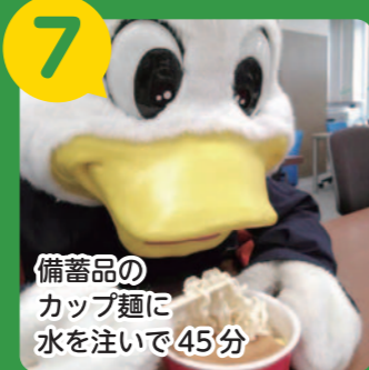
7 備蓄品のカップ麺に水を注いで45分