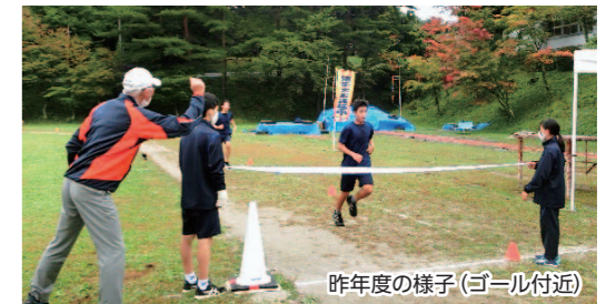
昨年度の様子(ゴール付近)

運営(監察員等)に参画される方を募集しております。ご関心のある方は原中学校(79-2455)までご連絡ください。