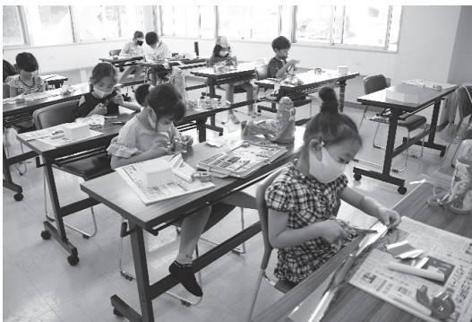
ジュニア教室 (光の箱を作ろう)