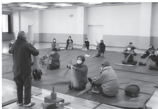
伝統文化講座 しめ飾り作り講習会