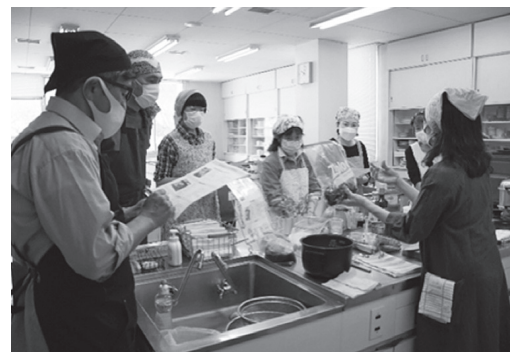
成人講座 地元野菜の料理教室