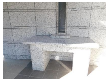
個別埋蔵場所 (納骨棚)