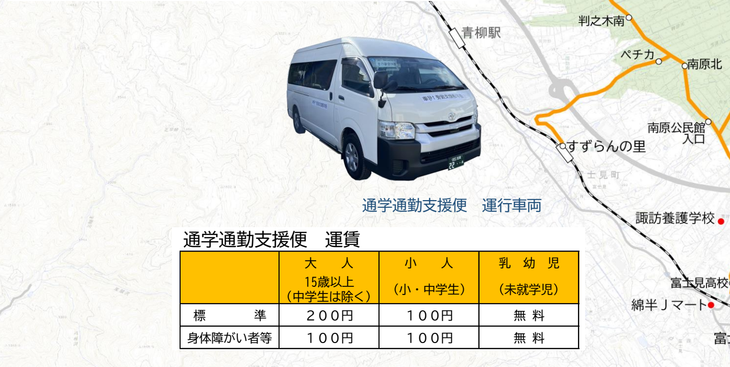
通学通勤支援便 運賃