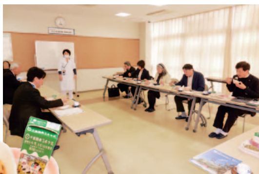
栄養士さんのお話を伺いながら米飯給食をいただきました。

「保育・教育に係る経費は投資である」、「南房総のすべての資源を活用して子ども達を育てる」という考えのもと、民間や地域住民と連携しながら教育行政が積極的に進められている。給食では「無償化」よりも“美味しく、シッカリとした食事の提供”を掲げ、地元農家とも密に連携して和食中心の完全米飯給食を提供している。子ども達の「食」に向き合う姿勢は村でも取り入れていきたい。