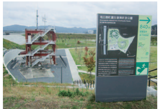
南三陸町震災復興祈念公園

南三陸町は災害を未然に防ぐ「防災」から、被害を最小化する「減災」にシフトし、耐震化等の対策による被害の軽減に加え、防災教育の徹底など「人命尊重を最重視した対応」を基本とした。参考となったのは、「災害時職員初動カード」を配布していることで、それぞれの職員が災害時取るべき行動を常に確認することが出来る。組織体制を定め、初動体制や集合場所等をルール化している。