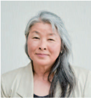
宮坂 早苗 議員