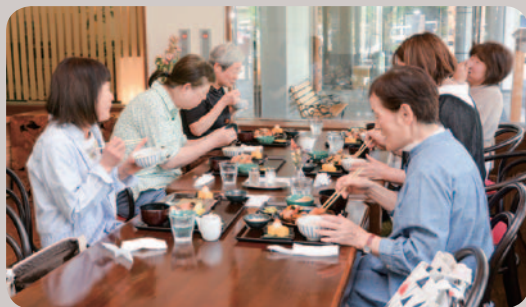
取材当日ランチに来られていた住民の皆さん