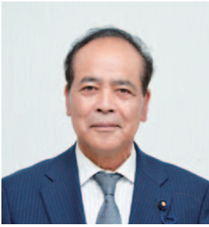
芳澤 清人 議員