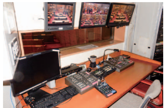
可児市の議会中継システム

全国でも先進的な取り組みを行っている可児市議会では、議会運営の効率化と透明性向上のためICTを積極的に導入。タブレット端末によって議案の迅速な共有とアクセスを可能とし、紙資源の節減にもつながっている。さらに子ども議会・中学生議会・高校生議会・ママさん議会・地域懇談会など幅広く住民参加の機会を設け、その意見を議会の政策提言に反映させるなど住民に開かれた議会づくりがなされている。