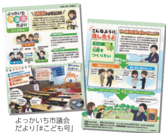
よっかいち市議会 だより「#こども号」