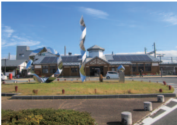
オガール（紫波中央駅）