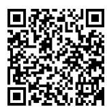
補足資料はこちらから

生涯学習課長 コミュニティセンター化により住民にとってより魅力的で便利な施設となる可能性がある。今後検討する必要がある。