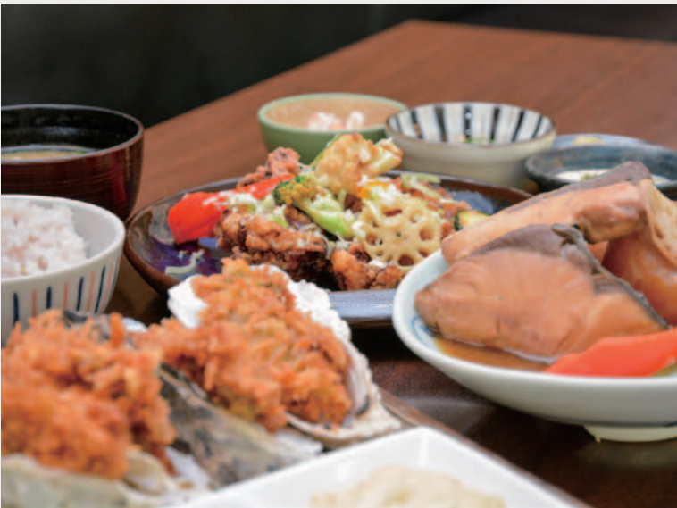
ランチは魚料理が主体のメニュー

このレストランが地元の方々にとって気軽に立ち寄れる、憩いのスペースになってもらえることが理想です。ランチに続いてディナー営業も開始しますが、ゆくゆくは朝から夜までレストランが営業している状態にした