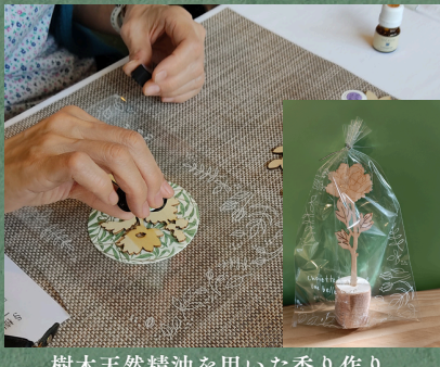
樹木天然精油を用いた香り作り 香りはお土産に♪