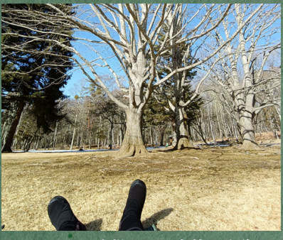
ピクニック広場でミニ森林浴体験!