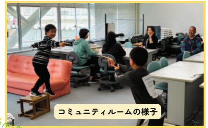
コミュニティルームの様子

今年度から旧パソコン室を校内中間教室兼コミュニティルームとしています。いつでも地域の方に集まっていただいて、子どもと関わってほしいと思います。子どもも地域の方も安心していただける場所、心が温かくなりつながれる場所を目指しています。