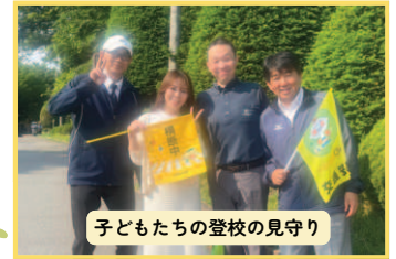
子どもたちの登校の見守り

この時間は子どもたちと囲碁将棋をしたり、歌を歌ったりなど交流活動も可能です！給食時にお弁当を持ってきて教室で子どもたちと一緒に食べることも可能です！