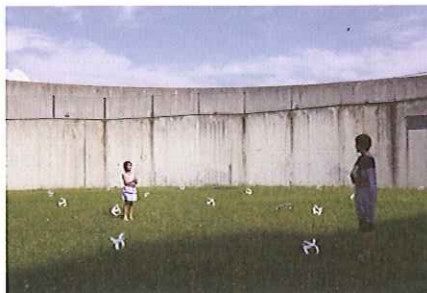
オリジナル風車づくり