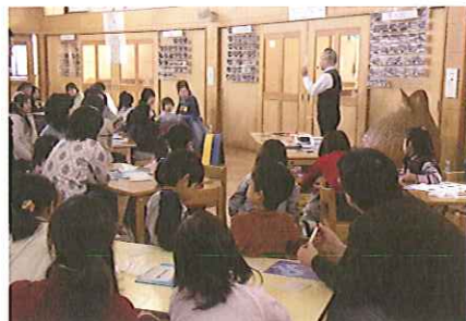
おもしろかんたん発想法

鉛筆と紙を使って、誰でもできる発想法を体験します。面白いアイデアを出して形にしてみましょう。こどもから大人まで、すべての世代の人に向けたデザイン発想法ワークショップです。