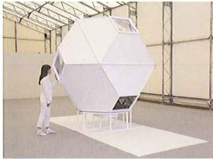
《コスモスキ》2015年 PioRyo(高橋綾 x 下山巖)