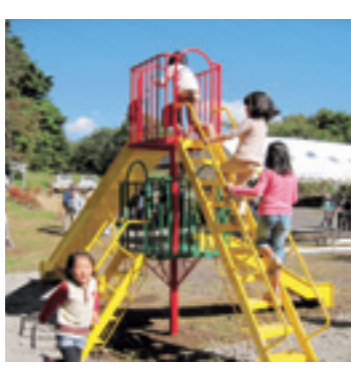
→ 南原区遊具(平成21年)