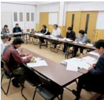
弘沢区説明会の様子▲

6月3日には、八ッ手区で防災訓練が行われ、6月6日には弘沢区で集落行動計画説明会が行われています。