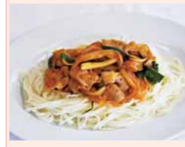
一口メモ 食欲が無くなる暑い時期に食べたくなる一品です。

お元気ですか? みなさんの善意による 無償の献血が、尊い命を救います 7月は「愛の血液助け合い運動」月間です。現在、全国で1年間に約500万人の方から献血への協力をいただき、その血液は輸血を中心とした医療を支えています。しかし近年は、輸血用血液の需要が増えている一方で、若年層の献血者数が減ってきています。人間の生命を維持するために欠くことのできない血液は、まだ人工的に造ることができません。さらに血液は生きた細胞で、長い期間にわたって保存することもできません。輸血に必要な血液をいつでも十分に確保しておくためには、絶えず誰かの献血が必要となります。