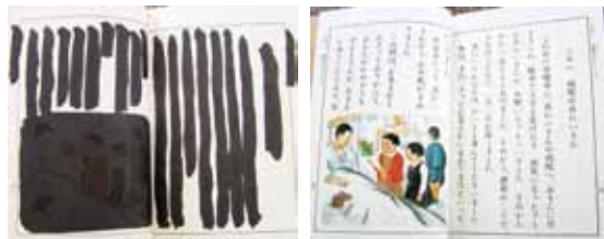
戦後、GHQ（連合国軍総司令部）の指導の下、教科書（写真右）の戦争に関する部分を墨で塗りつぶし（写真左）使用しました。

図書館くつろぎスペースの展示コーナーでは、自主グループや、個人の芸術作品、図書館が所蔵する珍しい資料などを展示しています。今年6月には「教科書の変遷〜きょうかしよ・いま・むかし」と題した展示を行いました。明治35年の教育勅語や、第2次世界大戦後の墨塗教科書は、注目を集めました。