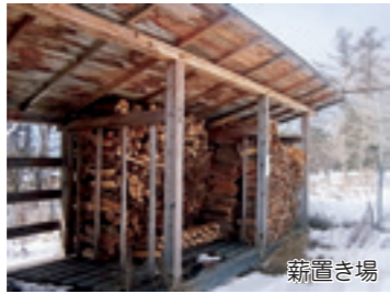
農林商工観光課農村整備係 ☎79-7932(直通)