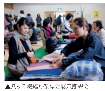
ハッ手機織り保存会展示即売会