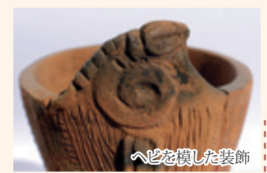
へびを模した裝飾

のもので、口縁部にとぐろを巻いたへびを模した裝飾がついた深鉢形土器です。へびの頭が三角形をしているものが多いことから、マムシと考えられています。