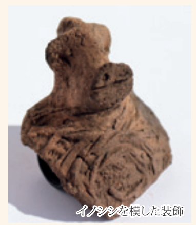
イノシシを模した裝飾

今回は動物が裝飾された土器を紹介... 縄文時代前期後半の今から約6000年前の頃で、口縁部にイノシシの把手が付いた土器が見られます。