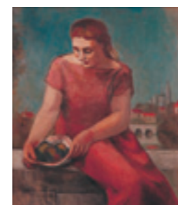
『果物籠の女』1925年 サロンドートヌ出品作 個人蔵

八ヶ岳美術館では、6月5日(日)まで「画家としての清水多嘉示展」を開催しています。ブルデルと出会い彫刻