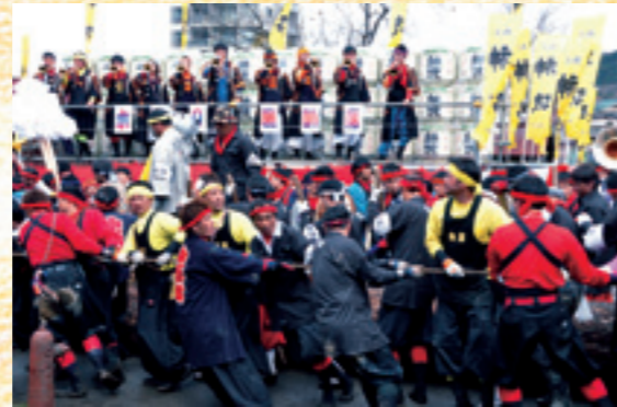
木落とし坂から宮川の河川敷までの曳行