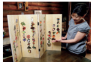
▲「吊るし雛」(製作期間:1週間) 色付きの和紙を組み合わせた優しい雰囲気作品です。66個の雛それぞれに意味が込められており、ひとつひとつ細かく丁寧に作られています。

ガキやメッセージをもらうこともあるそうです。「自分の作品により心が明るくなったと聞く」と、それはそれは嬉しいです。人の心に響くような切り絵を目指すのが一生の課題です。と嬉しそうにお話くださいました。 7月2日(日)18日(日)には、麻績村の信濃観月苑で「きりえ展『野の花二十四節気』」が開催されます。日達さん自信作「吊るし雛」も展示されるとのことですので、ぜひ足を運んでみてください。