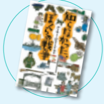
知らなかった、僕らの戦争 アーサー・ピナード編著(小学館)

長野まゆみ×田中健太郎「あめふらし」、穂村弘×ささめやゆき「赤ずきん」…。6人の人気作家と人気画家による夢の競演! 怖くて美しい、大人のための新・グリム童話集。