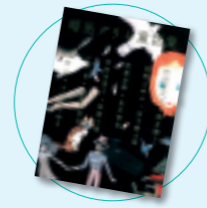
暗黒グリム童話集 村田喜代子 長野まゆみ他(講談社)

<パパ>日夏と<ママ>真汐と<王子>空穂。女子高生3人の<ファミリー>とそれを見守る同級生たち。3人の均衡の中で生まれるドラマを巧みに語る傑作長編。