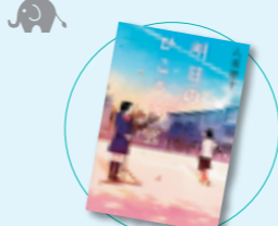
明日のひこうき雲 八東澄子(ポプラ社)

京都の天龍寺庭園、東京の小石川後楽園、石川の兼六園など、日本各地の67庭園を掲載。日本庭園の歴史だけでなく、庭園空間そのものやデザインに着目し、庭園の見方や楽しみ方についても、写真とともに紹介する。