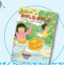
わんぱくだんのおかしなおかしや ゆきのゆみこ・上野与志作 末崎茂樹 絵(ひさかたチャイルド)

家族の問題に直面し、晴れない心を抱える遊。ある日、遊の目にとびこんできた、ひとりの少年。おもむろにふりかえった鋭いまなざしを見た、そのとき、急に体が浮き上がって…!? わんぱくだんシリーズ第21弾。