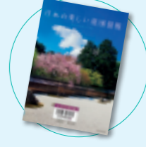
日本の美しい庭園図鑑 大野暁彦 鈴木弘樹(エクスナレッジ)

「敵性語」を習い、「毒ガス島」で働きた。もと「敵国」の詩人が耳をすまし、つかみとった「生きつづける体験」。文化放送「アーサー・ピナード」探しているうち、23名の戦争体験談を採録し、加筆・修正して再構成。