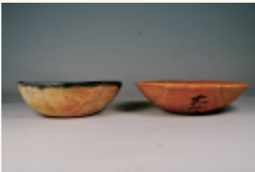
右 甲斐型土器 左 信州系土器(内黒)

村では、縄文時代の遺跡と同様に平安時代の遺跡も数多く見つかっています。今回は柏木地区の程久保遺跡の平安時代の住居から出土した坏と呼ばれる食器を紹介いたします。 平安時代の住居から出土する坏は、『土師器』の一つで、ロクロで成形し、素焼きした土器です。『土師器』は、坏以外に、皿、椀、甕などといった種類があります。 程久保遺跡では、平安時代の竪穴住居が24軒、堀立柱建物物が1棟見つかっています。さらに東隣の恩膳西遺跡の竪穴住居8軒見つかっており、2つの遺跡の竪穴住居は一つの集落であったと考えられ、村で見つかった平安時代の集落跡と比較しても、大きな集落であったと言えます。 程久保遺跡で出土した坏は、主に甲斐型土器と信州系黒色土器の2種類に分かれます。時期は10世紀中頃に11世紀前半のものと考えられます。甲斐型土器とは薄手で器の色が赤褐色をしており、外側にへらで斜めに削られているのが特徴で、山梨県を中心に諏訪周辺や静岡県にも広く分