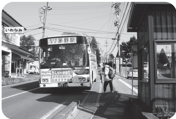
公共交通の検討はじまる