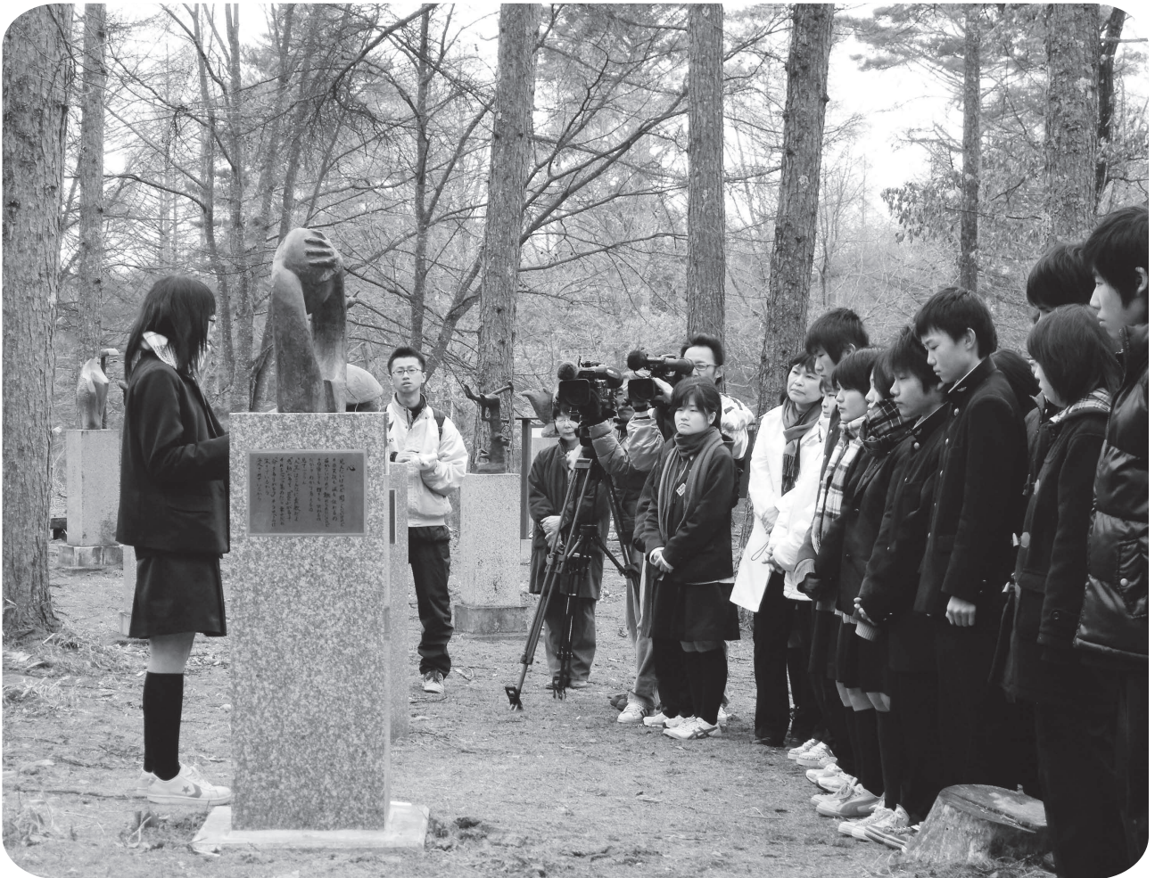
原中ブロンズ像除幕式