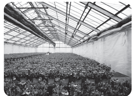
原村名が入った花 (新品目パンジーゼラニウム)

〔質問〕 悪徳商法、商品の不当表示、サービスの安全性に対する不安等消費者問題を取り巻く状況は深刻化している。実態と施策対応、学校教育における教育実態は。