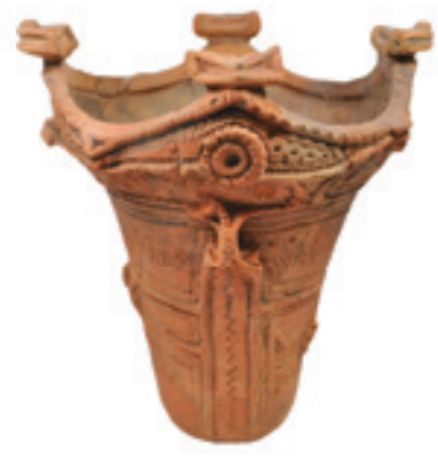
大石遺跡出土 深鉢土器

また県宝に指定された土器のうち12点は、八ヶ岳美術館で縄文人が意識した数にスポットをあてたミニ企画展(11月25日まで開催中)や、常設展で展示しています。