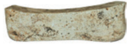
横から見た砥石

今回紹介した砥石は役場1階の村民ホールに展示してありますので、役場へお越しの際は、ぜひご覧ください。