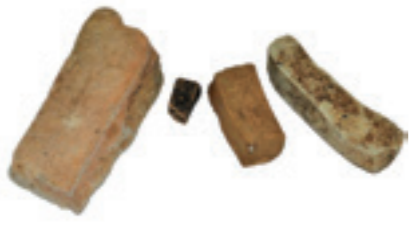
竪穴住居址から出土した砥石

鉄製の農工具でした。集落には鍛冶址も見つかり、鉄製品を作り、使用していた様子が分かっています。