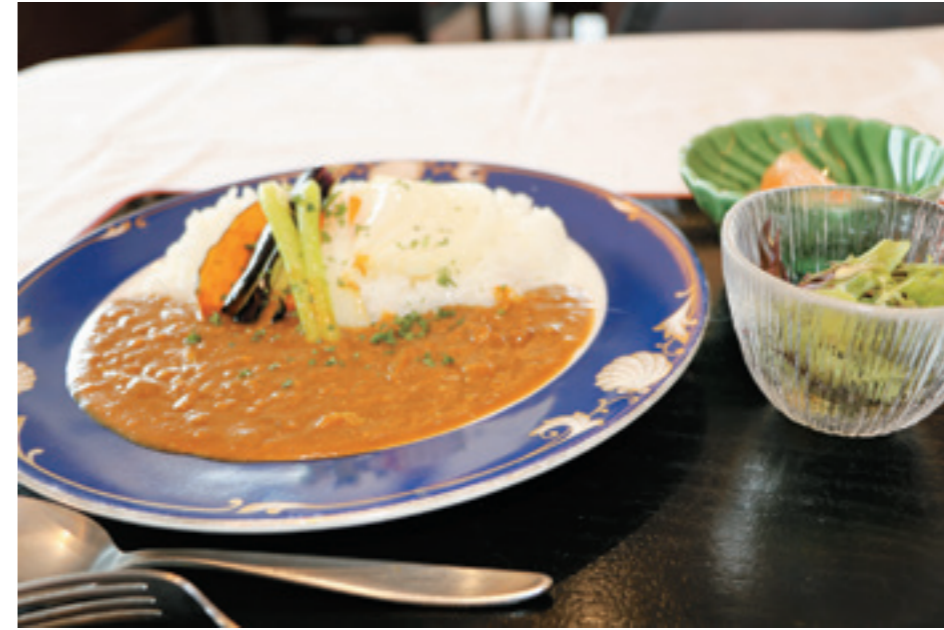
原村野菜 カレーライス 880円