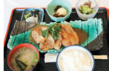
信州太郎ポーク 生姜焼き定食 1,100円