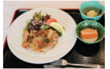
ガーリックチキン 880円