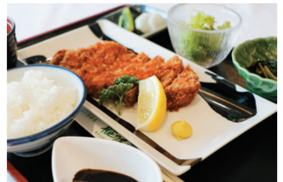
信州太郎ポーク とんかつ 1,100円