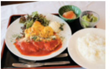
信州太郎ポーク ピカタ 1,100円