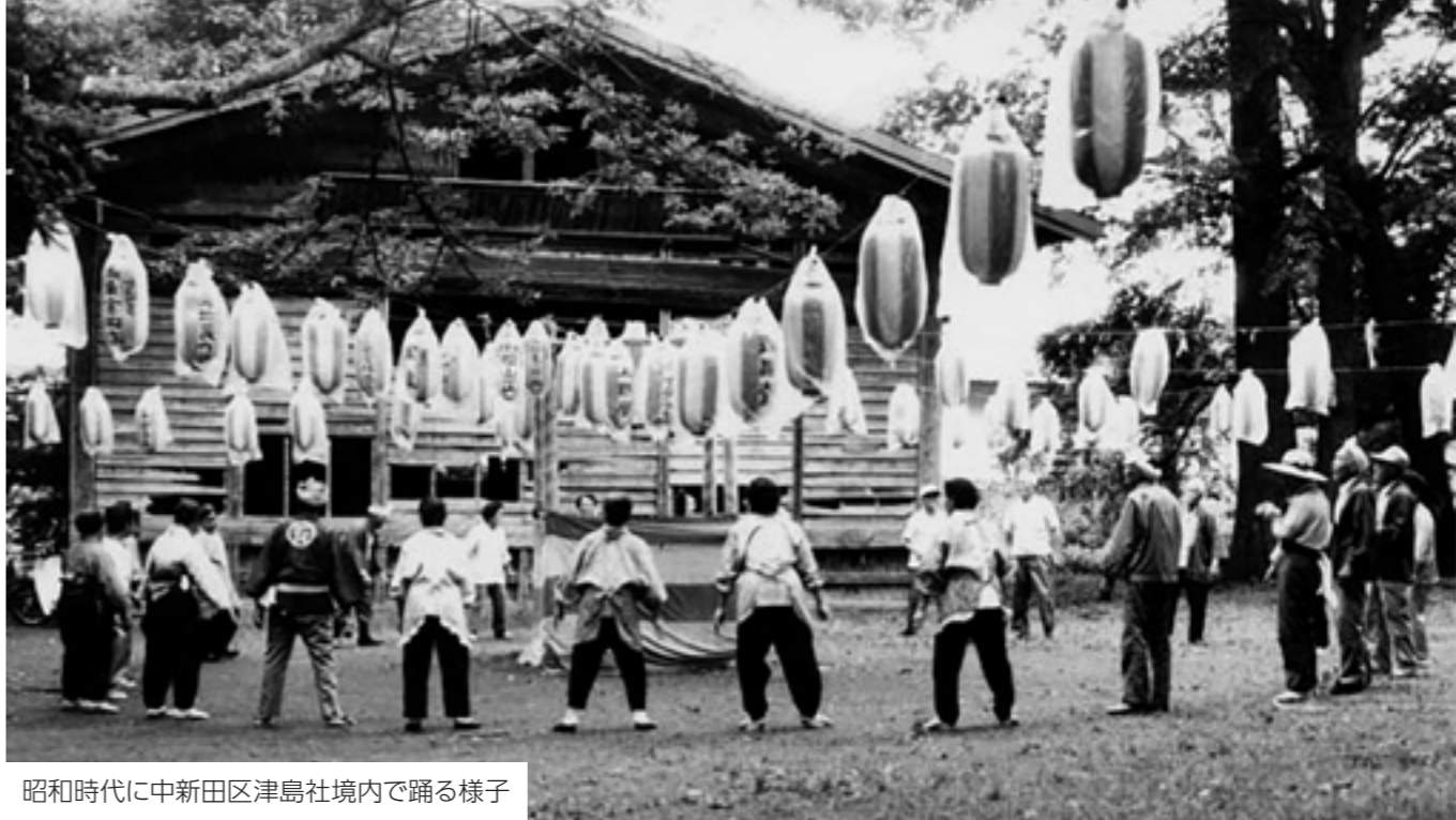
昭和時代に中新田区津島社境内で踊る様子