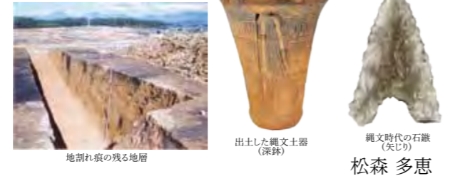
地割れ痕の残る地層 出土した縄文土器(深鉢) 縄文時代の石鏃(矢じり) 松森 多恵 問 生涯学習課 文化財係 ☎79-7930(直通)

今回紹介した遺跡の出土品は現在、役場1階の村民ホールに展示していますので、役場にお越しの際は、ぜひご覧ください。