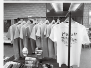
あきみ 地域おこし協力隊 坂口 陽史