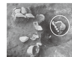
「フゥーちゃん」発見の様子

フゥーちゃんは現在、八ヶ岳美術館に展示されています(会いにきてください♡)。役場1階の村民ホールにも関連の展示がありますので、お越しの際は、ぜひご覧ください。