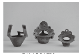
出土した釣手土器3点