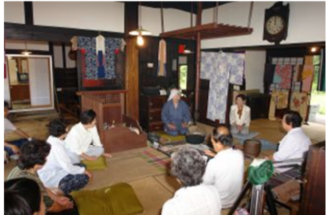
▲原村郷土館まつりの様子

椴の木荘の北側にある原村郷土館を夏季開館します。養蚕用具や農耕用具などを中心に公開し、開館期間中は、無料の「機織り体験」を行います。また、庭先には昔懐かしい「かぼちゃ棚」を作り、昔の面影を再現してきました。平成18年度に住民参加で昭和30年代のお勝手場や井戸等の復元をしました。より活用していただくため原村郷土館にふさわしい講座を行います。