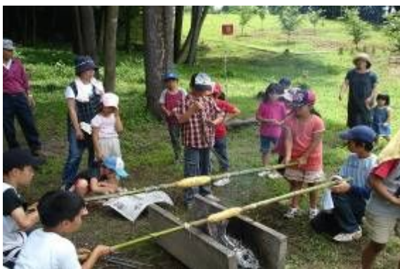
▲ジュニア教室「サマーキャンプ」