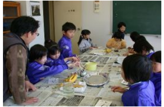
▲原っ子広場「絵手紙教室」