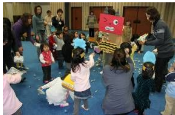
▲あひるクラブ「節分・まめまき」