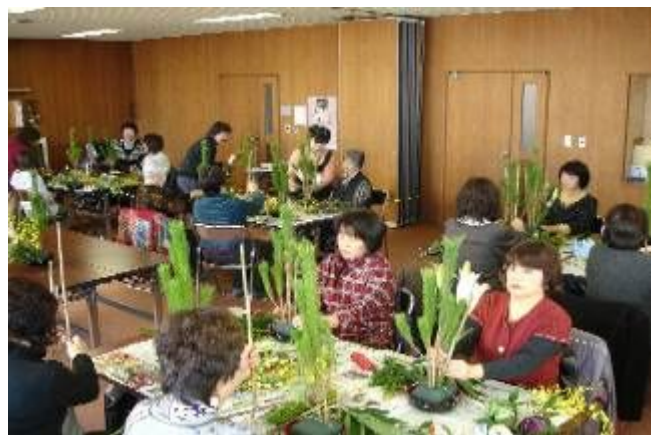
▲成人講座「フラワーアレンジ教室」