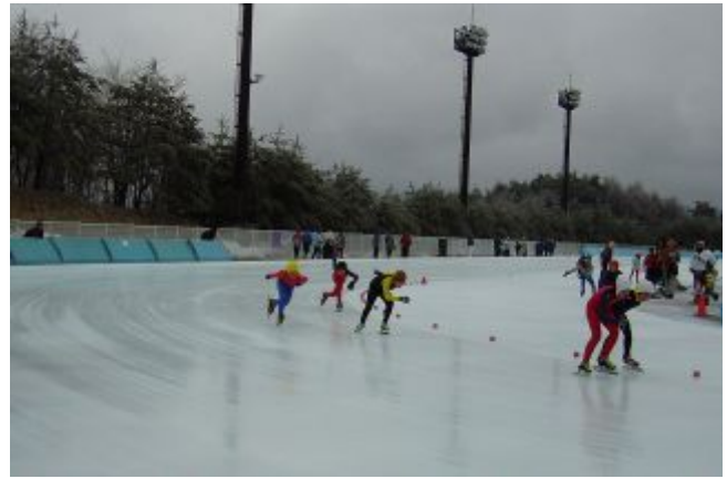
▲諏訪地方スケート大会