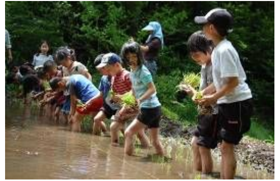
▲ジュニア教室「田んぼで遊ぼう」

子どもたちが心豊かでたくましく育つために、異年齢間の子どもの交流の場を提供し、考える力、自主性、社会性を育みます。