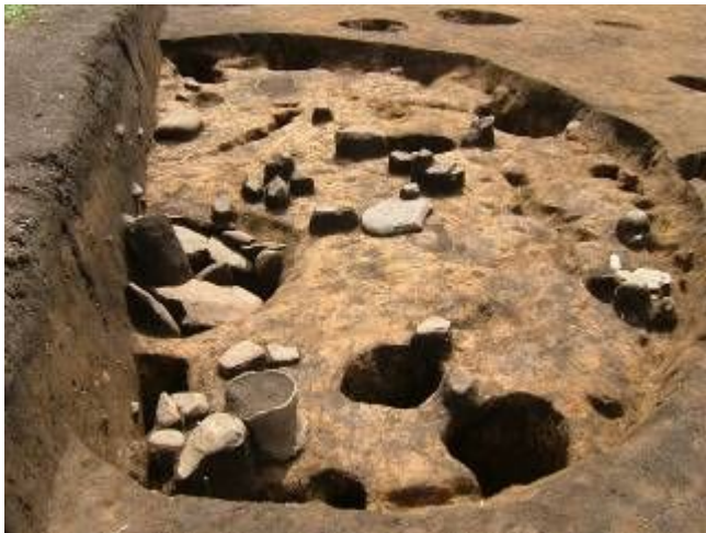
▲縄文時代の住居跡

長野県は遺跡の宝庫と言われ、原村には100に近い遺跡が点在しています。開発などで遺跡が壊される時は事前に発掘調査を実施し記録に残します。今までに行ってきた発掘で出土した土器や石器などの台帳を作り、土器は復元します。また、復元した土器の中には30年を経過したものがあり、接着剤が劣化したものは修復します。