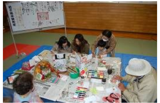
▲村民文化祭「体験コーナー」