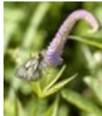
▲ミヤマシロチョウ（長野県天然記念物）