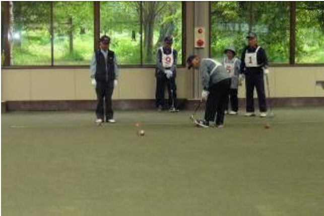
▲ゲートボール大会