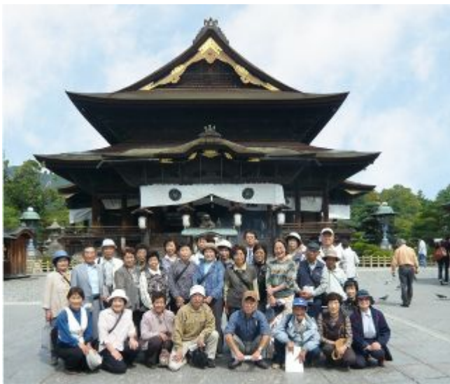
▲ふれあい学級「バスハイク」