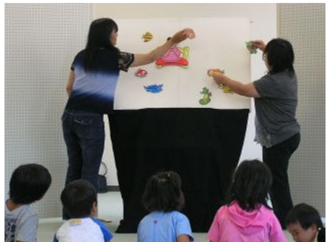
▲ボランティアグループのお話会