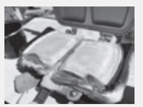
地域おこし協力隊 坂口 陽史