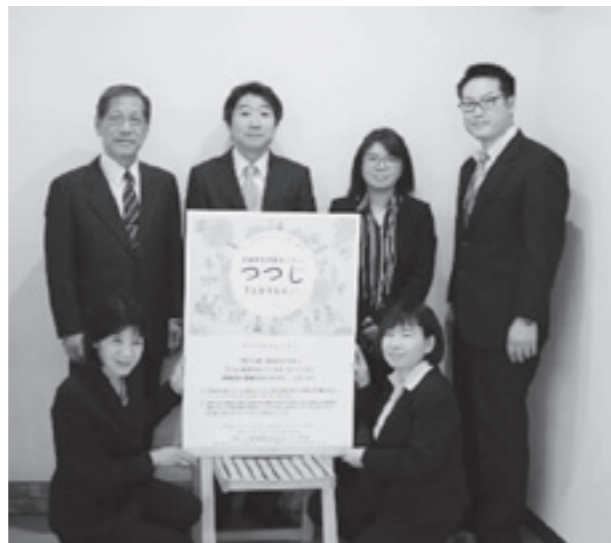
児童家庭支援センターつつじ スタッフ

☎児童家庭支援センターつつじ ☎75-1108 mail:chino_jikasen@tsutsuji.or.jp