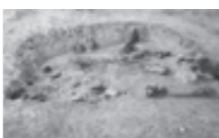
平安時代の焼失住居

今回紹介した遺跡の出土品は現在、役場1階の村民ホールに展示してありますので、役場にお越しの際は、ぜひご覧ください。