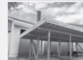
地域おこし協力隊員 坂口 陽史