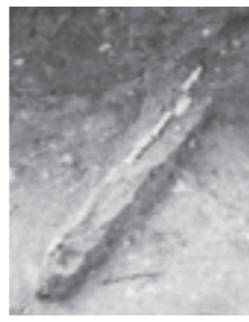
鉄製品(紡錘車の軸棒)