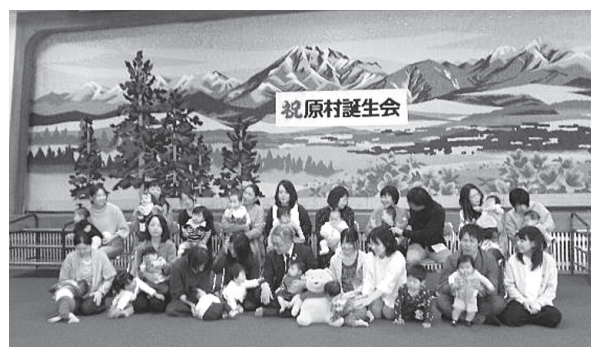
令和元年度原村誕生会（前期）

1歳の誕生日を迎えるに当たり、5ヶ月～10ヶ月の乳児を対象に年2回誕生会を開催し、お子さんの健やかな成長をお祝いします。歯科衛生士による歯の健康指導やハブラシ、図書館の協力によるブックスタート事業として「赤ちゃんが会う初めての絵本・ファーストブック」などの記念品を贈呈するとともに原村図書館利用カードをお作りしお渡ししています。