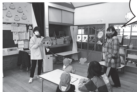
看護師による手洗と咳エチケットの指導