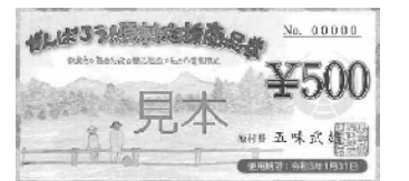
がんばろう!原村応援商品券