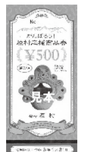
第2弾ががんばろう!原村応援商品券