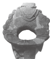
釣手土器(第14号住居址)

遺跡は残念ながら調査後の工事で消滅してしまいましたが、出土品は現在、役場1階の村民ホールに展示してありますので、役場にお越しの際は、ぜひご覧ください。