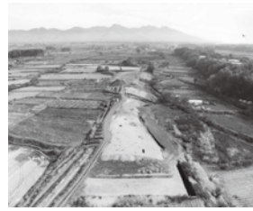
清水遺跡全景(西から)