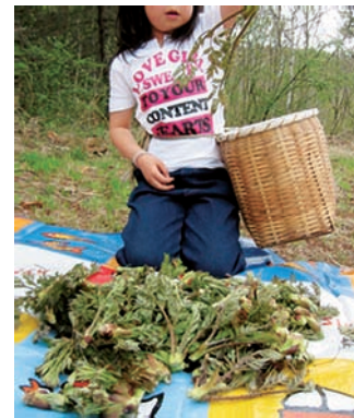
(保健福祉課吉川管理栄養士)

旬は土地によって変わります。すなわち場所と時期の関 期になるとあそこで 何々が沢山とれる」 となります。原村に は、「原村の旬」の食 べ物が沢山ありま す。そんな原村の食 べ物を大切にして季節 や、そのもの自体の おいしさを味わって いきましょう。