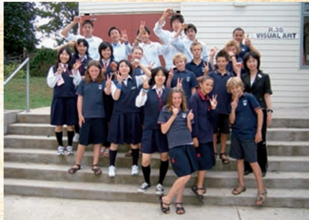
▲プケコヘインターメディアートスクールの生徒と共に

原村の国際化を推進し、国際社会に貢献できる人材の育成を目的に、姉妹都市ニュージランドプケコヘ区で中学生10人がホームステイを行いました。