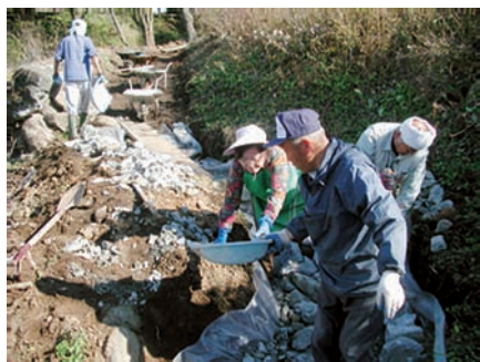
ホテル交流プロジェクト ホテル水路整備

習の進め方、学習成果の生かし方、住民参画の促進についての計画を示しました。第2次生涯学習基本構想の閲覧を希望される方は原村中央公民館内の教育課までお越しください。