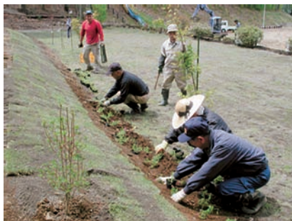
18年度おらほうのむらづくり事業 室内区 公園整備事業

推進委員会全体で取り組むテーマを設け、活動をはじめたのが、「ホテル交流プロジェクト」です。誰でも気軽に参加できる活動を実施に移す中で、生涯学習によるむらづくりに周知して行きたいと思っています。