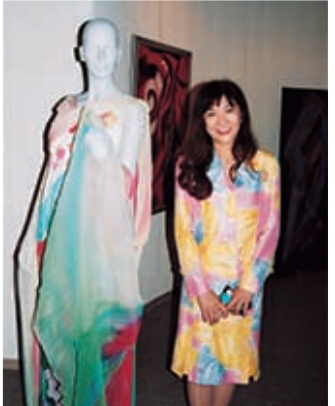
「こだわりの色、世界に1つしかない色をぜひ楽しみに来てください」

日時 8月4日(土) 午前11時から 約1時間 場所 八ヶ岳美術館 企画展示室付近 参加費 無料 (入館料別途) お問い合わせ 八ヶ岳美術館 ☎74-2701