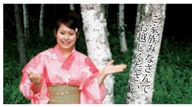
ご家族みなさんでお越しください。

日時 8月18日(土) 午前10時～午後8時30分 場所 原小学校校庭及び校庭 南駐車場(旧小学校プール跡地) お問い合わせ 原村よいしょまつり 実行委員会事務局 ☎79-7929