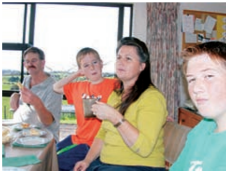
真冬のNZフランクリン市プケコへ(家庭の中はもちろん外も温かです)

原村は、ニュージーランド(NZ)・フランクリン市・プケコへの間で相互友好都市を締結し、今年で5周年を迎えます。また過去10回の中学生海外ホームステイを実施し1200人の生徒と23人の引率者がプケコを訪れています。友好都市との交流がさらに深まることを願い、(財)自治体国際化協会(CLEA)の地域国際化施策支援特別対策事業の補助を受け、テ・ハエレンガプロジェクト(マオリ語で様々な交流と出会い)として大人の訪問団を友好都市に派遣いたします。参加を希望される方は、8月20日(月)までに、村づくり戦略推進室までお申し込みください。