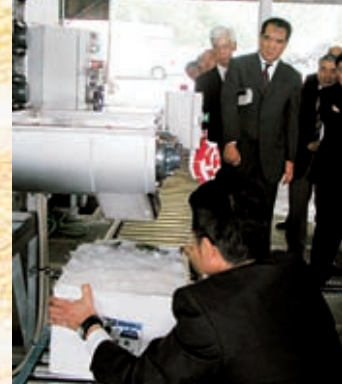
県下最大級の製氷施設!

セロリに次ぐ基幹品目とされるブロッコリーを、高品質で市場へ供給し諏訪ブランド産地競争力の強化を図り生産農家の所得を確保するために、信州諏訪農業協同組合では製氷搬水施設を改修しました。村長は、ブランド化消費されるようになれば嬉しい、50億円の生産出荷を取り戻す一端を担ってほしいと述べました。