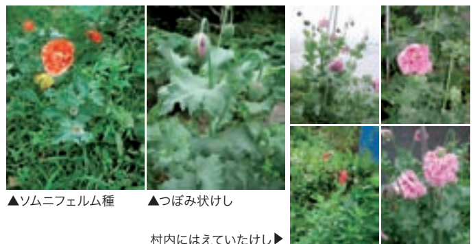
▲ソムニフェルム種 ▲つぼみ状けし