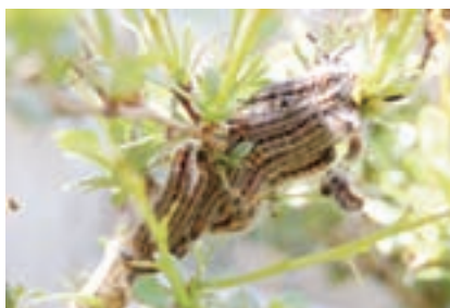
メギを集団で食べる幼虫

日本チョウ類保全協会に よる各地の生息環境の調査 では安定して発生している生 息地は南アルプスの一部と浅 間山系の一部に過ぎないこ とが解っています。かつては 八ヶ岳が日本最大の生息地 域でしたが御小屋・蓼科・霧 が峰・海ノ口・野辺山・清里 では絶滅し、現在では広河 原沢・立場川・観音平の上部 に少数の生息が確認できる