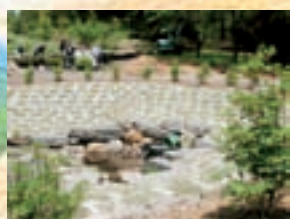
※南原 湧き水の周囲

平成5年度県営圃場整備事業として採択され事業を進めてきましたが、平成12年には国の制度が変更となり、一部、担い手型の圃場整備事業として事業実施し、事業完了となり、換地処分公告後登記となります。