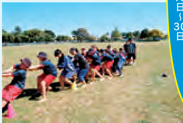
原中学校の生徒対プケコへの生徒でクリケットや綱引きの試合が行われ、交流が深まりました

異文化に対する理解と認識を深め、国際社会に貢献する豊かな人間形成づくりや国際感覚豊かな人材を育成する事を目的に、友好都市ニュージージーランドプケコへ区に原中学校の生徒10人がホームステイを行いました。3月19日から始まった12日間のプログラムでは、ホームステイのほか、自然体験ができるサンシャイン牧場やオークランド市の見学、ワイトモ洞窟や国鳥でもあり希少動物だと言われているキウイバードの動物園「キウイバード園」なども訪れ見聞を広めました。