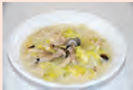
一口メモ オムレツにかけたり、ご飯にかけてドリア風にしたり、パスタにかけても美味しいです。