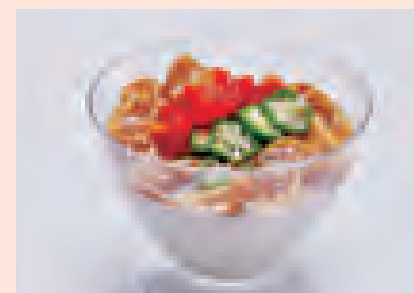
一口メモ ひんやり冷やして、食欲の落ちる夏の栄養補給として最適なミルク豆腐です。