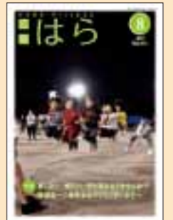
●表紙写真/「夏の熱戦!第25回村民スポーツ祭」

7月13日に原小学校校庭で、第25回原村村民スポーツ祭が開催されました。綱引きや、長縄跳び、玉入れ、年齢別リレーなどが地区対抗で行われ、熱戦が繰り広げられました。参加した皆さんは、競技に出場したり、出場選手に声援を送ったりと、スポーツ祭を楽しみ、親ばくを深めていました。