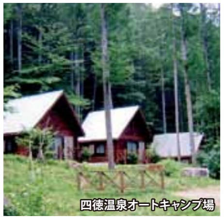
四徳温泉オートキャンプ場

前から地区のシンボルとして栄えていた四徳温泉を核に、宿泊施設やオートキャンプ場の運営、遊歩道の整備、陣馬形山までのトレッキングコース整備など、自然を生かした里づくりをおこなっています。