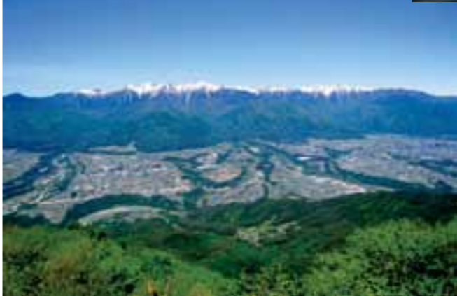
陣馬形山からの眺望

★陣馬形山 村の北東に位置する陣馬形山は、村のシンボルとして村民から愛されています。標高は1445メートルとそれほど高くはありませんが、360度の大パノラマの山頂からは中央・南アルプスの山並みが目の前に広がり、眼下には天竜川をはじめ伊那平全体が見渡せます。国内でも屈指の航空写真に匹敵する展望スポットとして知られており、古くは戦国時代、武田信玄の狼煙台として軍事的な情報伝達などに使用されたと言われています。