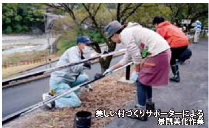
美しい村づくりサポーターによる景観美化作業

このほか、一般住民や村職員から「美しい村づくりサポーター」を募集し、美しい村づくり戦略マップの作成や公園のガードパイプの塗り替え作業なども行っています。