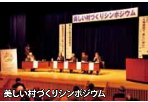
美しい村づくりシンポジウム

景観保全と地域資源を活かした村づくりに向けて平成25年度には「中川村美しい村づくり条例」を制定しました。条例では景観審議会を設置し、村の良好な景観形成に重要な役割を果たす建造物・樹木・史跡などを景観保全資産に指定して保全を図ったり、景観育成や廃屋の除去改修、看板類の撤去・更新に補助金を出すなど、美しい村の維持・発展に努めています。