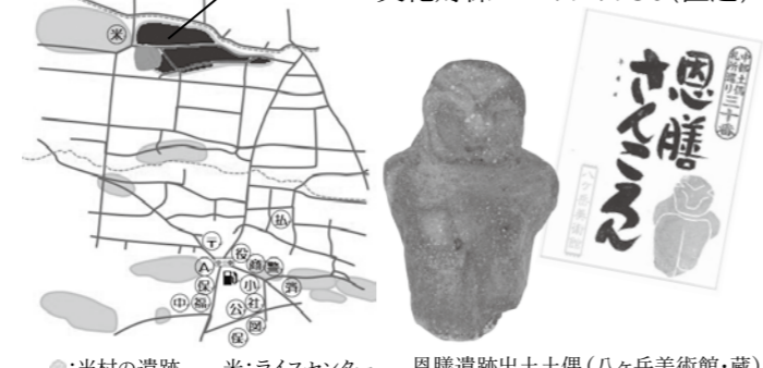
●:当村の遺跡 米:ライスセンター 恩膳遺跡出土土偶(八ヶ岳美術館・蔵)