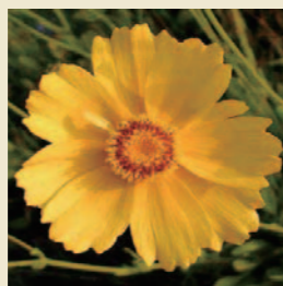
オオキンケイギク 【特定外来植物】