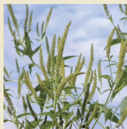
オオブタクサ 【生態系被害防止外来種】