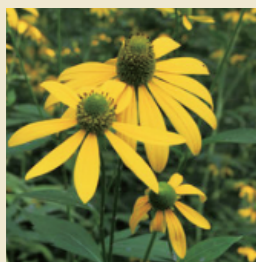
オオハンゴンソウ 【特定外来植物】